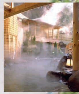
ラジウム 蒸気風呂