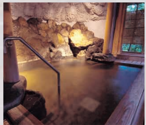
逢水の湯と投入堂洞窟風呂

三朝温泉を流れる三徳川の上流、三徳山にある鳥取県唯一の国宝「投入堂」をモチーフにした、庭園風呂を見下ろす洞窟風呂