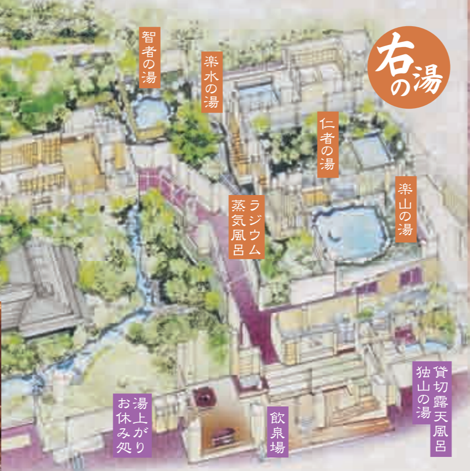
貸切露天風呂 独山の湯