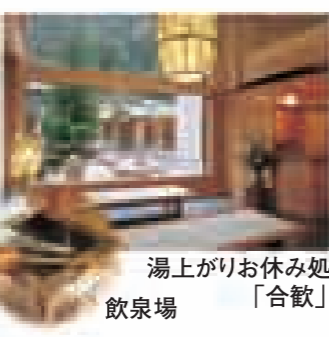
湯上がりお休み処 飲泉場 「合歓」

三朝温泉ならではのラジウム蒸気風呂を設置。蒸気となった温泉は呼吸によって体内に取り込まれ、細胞を活性化させます。