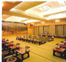
大宴会場「花まつり」