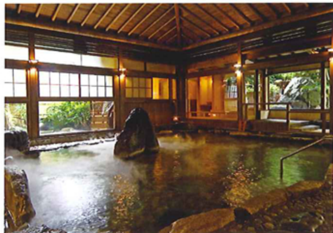
②楽山の湯 野趣あふれる自然石を組んだ大浴場。いにしへの三朝の温泉情緒に浸れることでしょう。