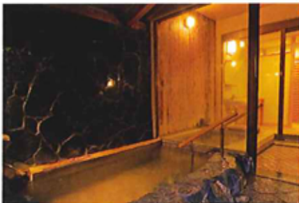
⑩貸切露天風呂 独山の湯