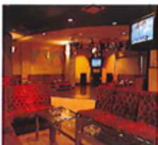
クラブ「ジヴェルニー」