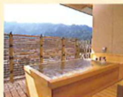
一般客室露天風呂