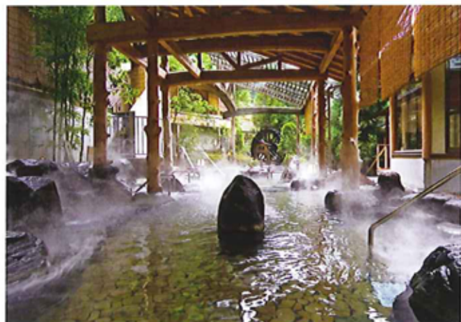
①庭園露天風呂 庭園の眺めを楽しむ開放感あふれる露天風呂。歩行湯や逢水の湯などの異なった趣のお風呂もお楽しみいただけます。