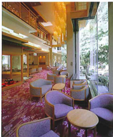
吹き抜けの天井と大きな窓、開放感にあふれたティーラウンジ。大きな窓からは純和風庭園「依水苑」を一望できます。