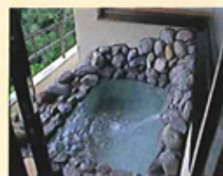
貴賓室「桜川」露天風呂