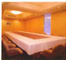
パーティールーム「梨花」