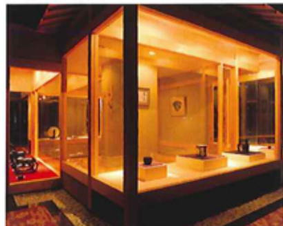
ロビー「ぎやらしい岩崎」